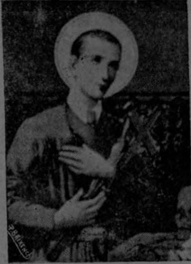
San Gerardo María Mayela

Pía Unión Universal de San Gerardo María Mayela, celebrada en la ciudad de Alajuela en el templo de la Agonía, por los Rvdos. padres Redentoristas el 21 de los corrientes